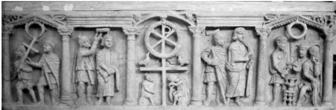
Sarcófago de la Pasión, siglo IV d.C. Imagen de la Resurrección. Museos Vaticanos, Museo Laterano, Roma.

Puede completarse añadiendo otros elementos, como las letras alfa (A) y omega (Ω), que representan el principio y fin de todas las cosas.