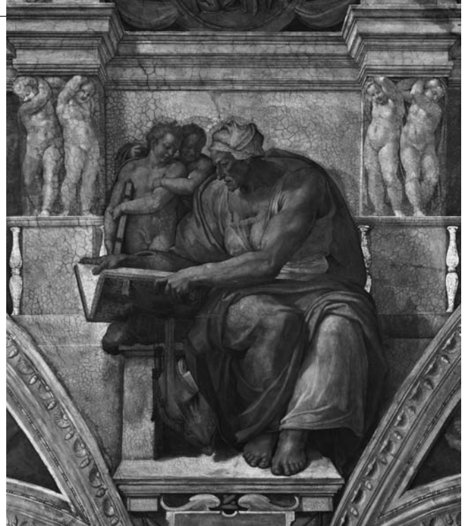
La sibila de Cumas, pintada por Miguel Ángel en la Capilla Sixtina. Ciudad del Vaticano.

1 ¿A qué se dedica la sibila? ¿Dónde habitaba? ¿En la mitología griega hay alguien semejante?